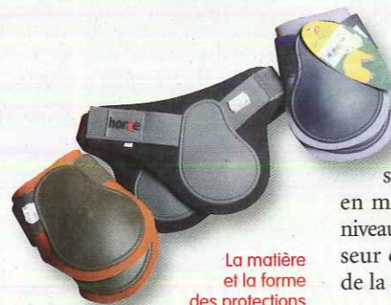
La matière et la forme des protections de travail peuvent influer sur leurs qualités amortissantes.

commandé, ou un howlett. Dans tous les cas, l'objectif est toujours de ne se servir d'un enrênement que de façon transitoire, pour franchir certaines étapes. En longe, utilisez-les comme des outils de musculation, pas comme moyen de contention. Les protections de travail ne sont pas forcément indispensables, surtout pour les chevaux calmes, sans problème d'aplombs