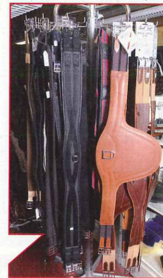
Le choix de la sangle dépend notamment de la discipline pratiquée. Un modèle à bavette est parfait pour le saut d'obstacles.