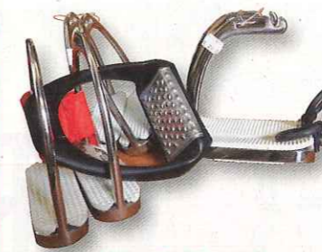
Aujourd'hui, de nombreuses innovations techniques peuvent vous être d'une grande utilité et améliorer votre confort.